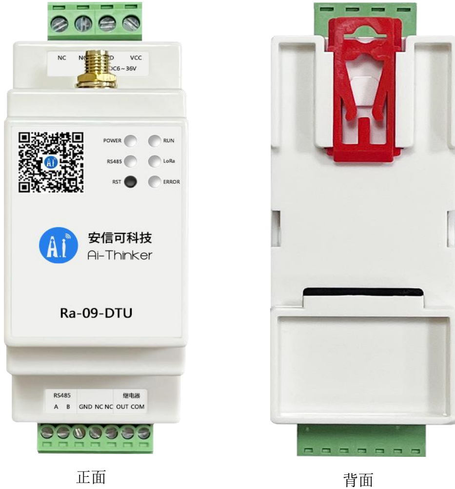
图 1 外观图（渲染图仅供参考，以实物为准）